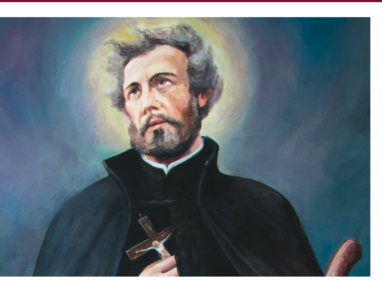
Św. Andrzej Bobola (fragment obrazu Bronisława Podsiadłego SJ, Muzeum św. Andrzeja Boboli)